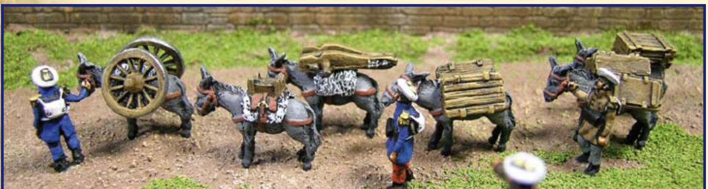
Fuerzas Carlistas transportando una pieza de artillería