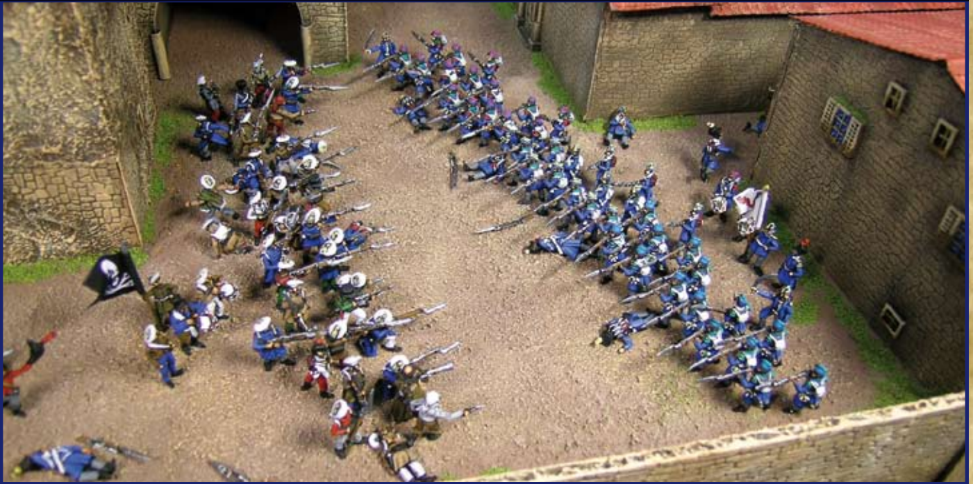
Carlistas e Isabelinos combaten en Luchana